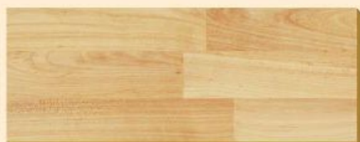
Arce Alpino PR D 1371