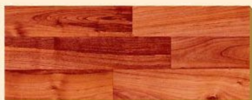
Cerezo Silvestre PR D 1359