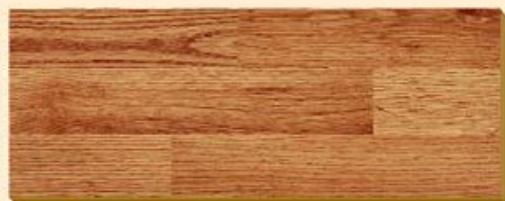
Roble Country PR D 1411