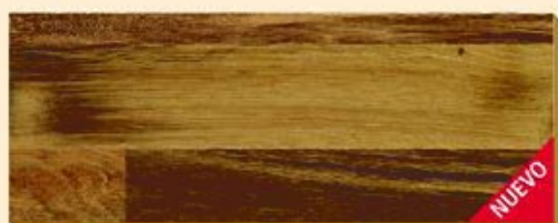
Roble Portland PR D 2780