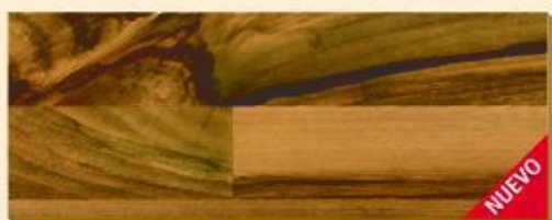
Nogal Ticino PR D 1440