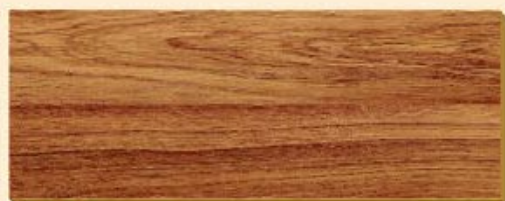
Roble Brandenburg PR D 1210

Presenta ya un grosor superior al de la versión básica y, además, su relación calidad/precio lo hace extremadamente económico. Ideal para áreas residenciales de bajo, medio o alto tráfico, aunque también para locales comerciales de tráfico moderado. Sobre todo allí donde lo que cuenta es cada milímetro. Gracias al sistema de unión "Clic2Clic", Smart puede colocarse fácil y rápidamente con ayuda de un martillo y un taco para golpear, como todos los pavimentos laminados de Kronotex .