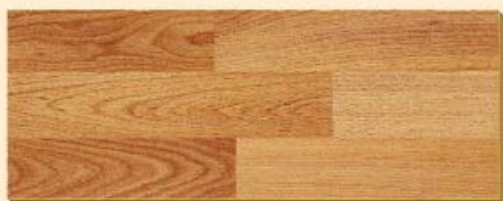
Haya Nobelle PR D 1424