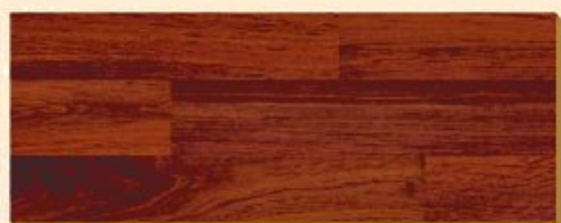
Merbau PR D 1329